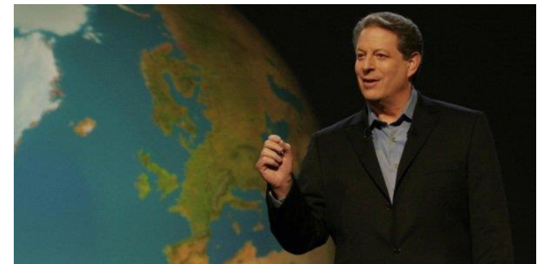
Al Gore difende il pianeta