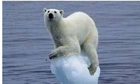
Gli effetti del riscaldamento terrestre