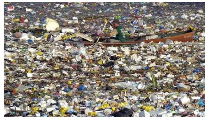
L'ossessione dell'uomo per la plastica