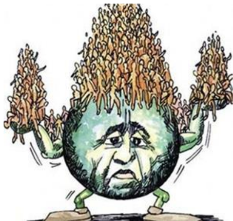
L'aumento enorme della popolazione