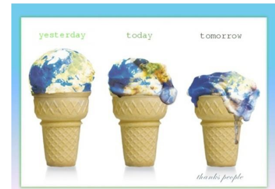
Il cambiamento climatico